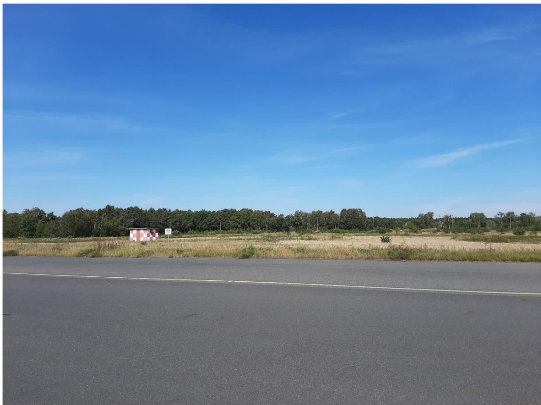
Tegeler Stadtheide